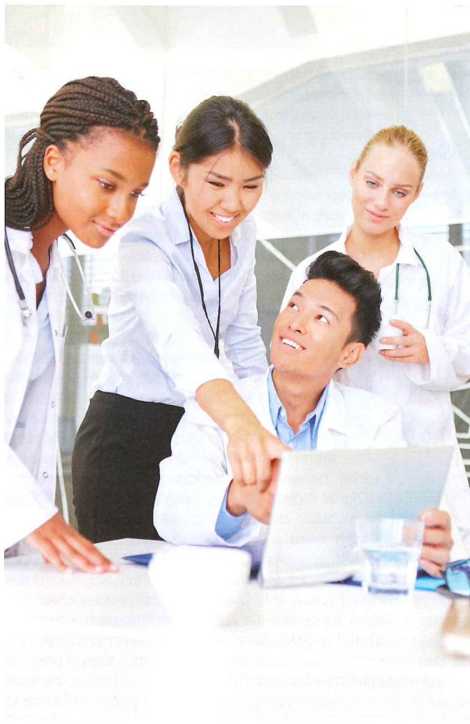
Nur der Außendienst kann beurteilen, auf welchen Kanälen die Kommunikation mit dem Arzt sinnvoll ist.

Dabei muss er beachten, dass eine Zielgruppe nicht zu unspezifisch ge-