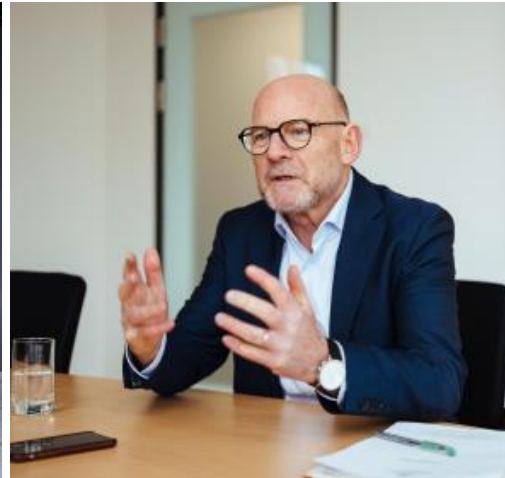
Winfried Hermann, Minister für Verkehr des Landes Baden-Württemberg