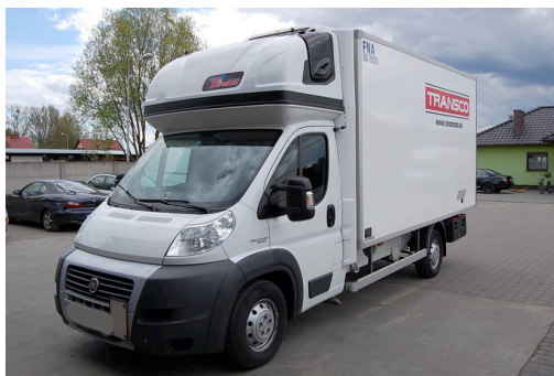
Transporter für die GDP-konforme Beförderung von Pharmazeutika nach Eurasien

TRANSCO bietet GDP-konforme Pharmatransporte nach Eurasien an – die Karte zeigt eine exemplarische Auswahl von Relationen