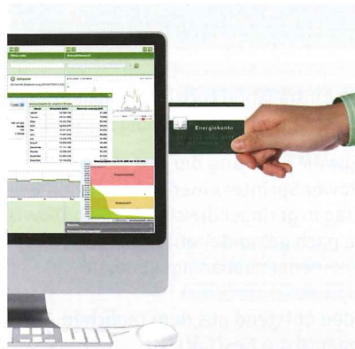
Bild 1. Das Energiekonto online

Abhilfe schafft hier »meine-energie.de«, ein webbasiertes Komplettwerkzeug für das kaufmännische Energiemanagement. Es unterstützt vielfältige Prozesse wie das Energiecontrolling, die Erstellung von Energiebilanzen, das Verwalten von Kosten und Verbrauchswerten, die detaillierte Kosten- und Verbrauchsplanung, die