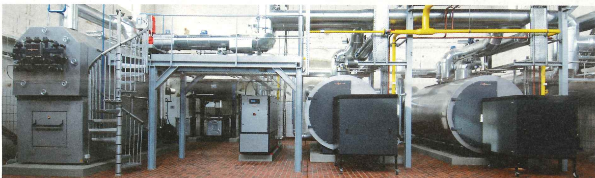
Die immer komplexeren Heizanlagen müssen regelmäßig gewartet werden. Kommt es zu einem Problem, müssen sie schnell wieder laufen. Hierfür werden alle operativen und buchhalterischen Vorfälle des technischen Service in der NEO Mobile Suite abgebildet und im SAP ERP-System integriert.